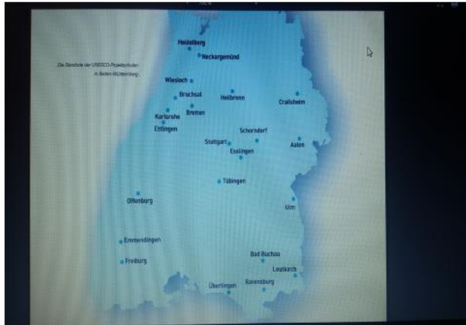
UNESCO – Schulstandorte in Baden - Württemberg